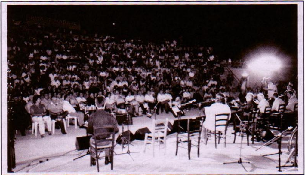
Στιγμιότυπο από την εκδήλωση

Η εκδήλωση έλαβε χώρα στο ανοικτό θέατρο του χωριού. Η προσέλευση του κοινού ξεπέρασε κάθε προσδοκία. Πλήθος κόσμου κατέκλυσε όχι μόνο το θέατρο, αλλά και όλο το χώρο γύρω από αυτό. Το θέατρο έχει χωρητικότητα πεντακοσίων ατόμων και υπολογίζεται ότι την εκδήλωση παρακολούθησαν πάνω από χίλια άτομα. Μέχρι και στο δρόμο για το Ανάκωλο στέκονταν κάποιοι. Η εκδήλωση, η οποία είχε ανάλογη υποστήριξη από τα τοπικά μέσα ενημέρωσης, έλκυσε και πολλούς εκτός Λακωνίας(από τους γύρω νομούς, την Πάτρα, την Αθήνα). Ανάμεσά στους θεατές ήταν και ο συνθέτης και λαϊκός τραγουδιστής Βαγγέλης Κορακάκης, ο οποίος εκτός προγράμματος, έλαβε το μικρόφωνο και τραγούδησε, τιμώντας έτσι τη μνήμη του Άκη Πάνου. Η εκδήλωση σημείωσε μεγάλη επιτυχία. Αυτό μαρτυρείται και από το γεγονός ότι η Ελευθεροτυπία στη σελ.27 του φύλλου της Τετάρτης 16 ης Ιουλίου 2008 έκανε εκτενή αναφορά στην εκδήλωση με εγκωμιαστικά σχόλια.