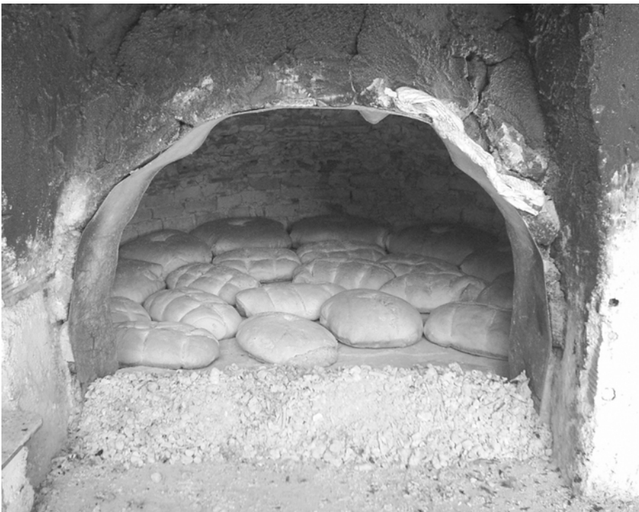
ΠΕΡΙΟΔΟΣ Δ΄ ΤΕΥΧΟΣ 53 ο ΔΕΚΕΜΒΡΙΟΣ 2010