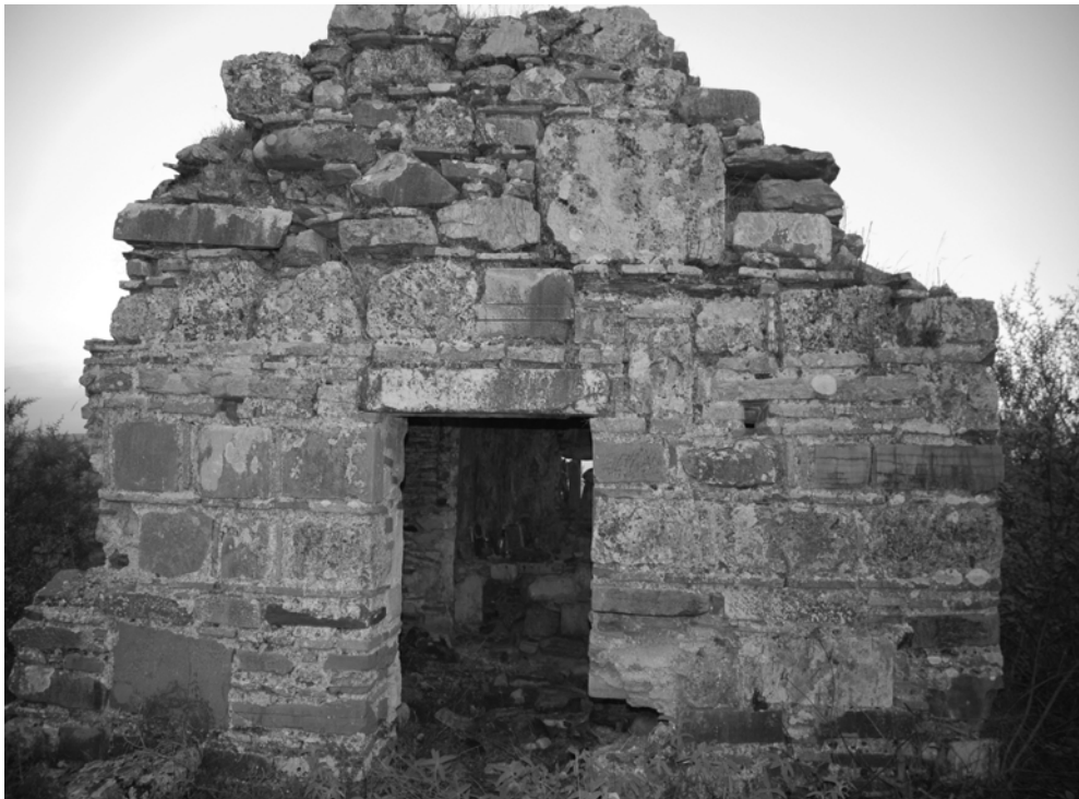
ΠΕΡΙΟΔΟΣ Δ΄ ΤΕΥΧΟΣ 55° ΔΕΚΕΜΒΡΙΟΣ 2011