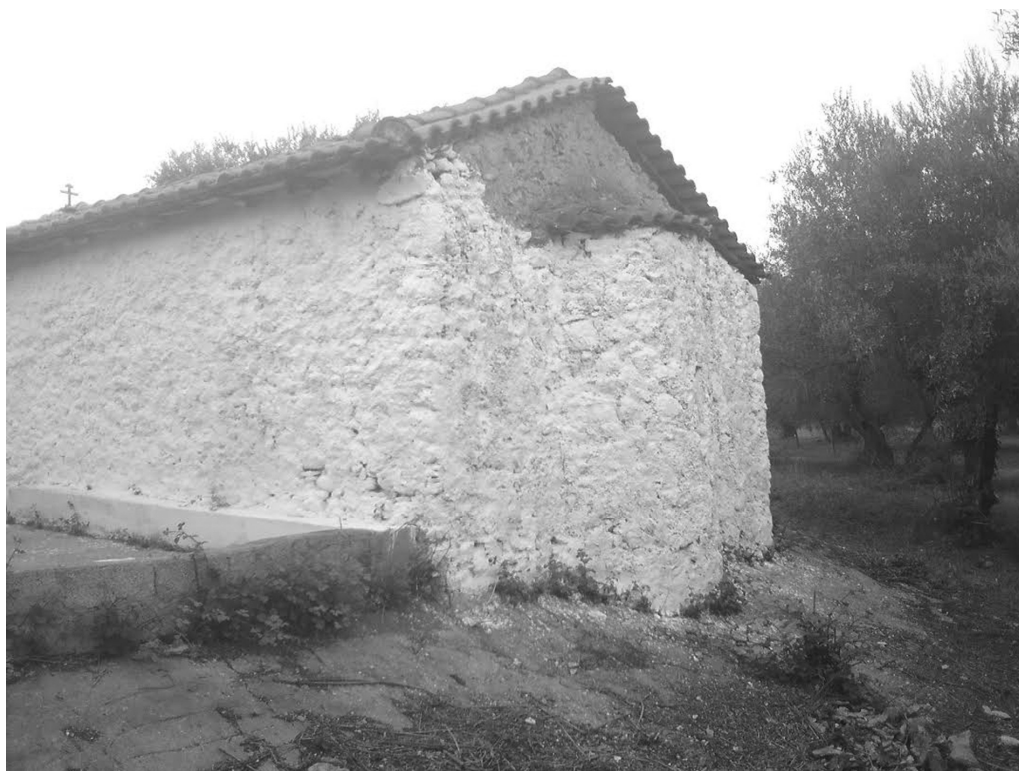
ΠΕΡΙΟΔΟΣ Δ΄ ΤΕΥΧΟΣ 63 ο ΔΕΚΕΜΒΡΙΟΣ 2015