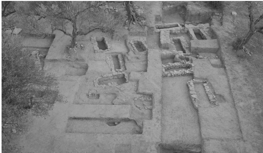
Το Βόρειο Νεκροταφείο στον Άγιο Βασίλειο

Κοντά στα κτίρια του παλατιού, στην βόρεια άκρη του λόφου, βρέθηκε κάτι άλλο, ίσως όχι εντυπωσιακό, αλλά και αυτό με τον τρόπο του σημαντικό: Ένα νεκροταφείο, που το ονομάζουμε λόγω της θέσης του το Βόρειο Νεκροταφείο.