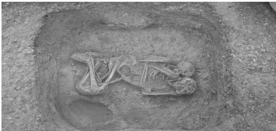
Το αγκαλιασμένο ζευγάρι

Τέλος, υπάρχει άλλος ένας λόγος που η ανασκαφή του Βόρειου Νεκροταφείου είναι σημαντική: Σε ένα αρχαίο νεκροταφείο βρισκόμαστε αντιμέτωποι με το παρελθόν, μπορούμε να αγγίξουμε ανθρώπους που ζήσανε τρισήμιση χιλιάδες χρόνια πριν και να φανταστούμε τα αισθήματα, τις αγωνίες και τον πόνο τους. Δεν χρειάζεται να είναι κανείς αρχαιολόγος, ή να έχει ειδικές γνώσεις για να συγκινηθεί, όταν βλέπει ένα μικροσκοπικό λάκκο με ένα μωρό προσεχτικά ακουμπισμένο στο έδαφος, σκεπασμένο με μια μικρή πλάκα και ένα κυπελλάκι τοποθετημένο ανάποδα πάνω της - σαν αυτός που το έβαλε εκεί (η μητέρα; ο πατέρας;) να ήθελε να πει ότι δεν θα χρησιμοποιηθεί ποτέ πια. Κάποιες ταφές μάς προβληματίζουν και μας γεμίζουν ερωτήματα: Σε έναν μεγάλο λάκκο βρήκαμε ένα ζευγάρι, έναν άνδρα και μια γυναίκα, γύρω στα σαράντα 6 , σφιχταγκαλιασμένους, με το κεφάλι της γυναίκας να γέρνει απαλά στην παλάμη του άντρα. Είναι βέβαιο ότι πέθαναν την ίδια στιγμή – πώς συνέβη όμως αυτό και γιατί; Και γιατί τους θάψανε μαζί; Μπορεί η μελέτη των σκελετών να μας δώσει την απάντηση, μπορεί όμως και να μην το μάθουμε ποτέ με απόλυτη βεβαιότητα. Δεν πειράζει, κάτι από το παρελθόν θα μας ξεφεύγει πάντα. Ίσως αυτό είναι και η γοητεία του.