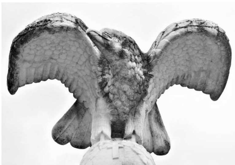
Ο περήφανος αετός

Μόνο έτσι πραγματικά τους τιμούμε. Όπως τους αξίζει.