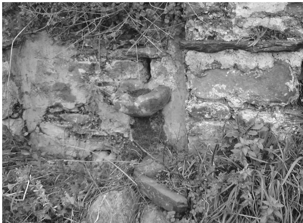
ΠΕΡΙΟΔΟΣ Δ΄ ΤΕΥΧΟΣ 67 ο ΔΕΚΕΜΒΡΙΟΣ 2017