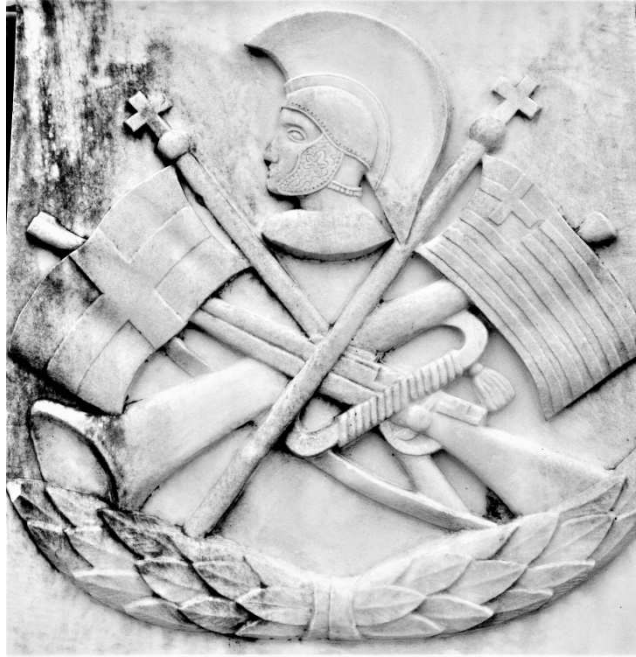
Σκαλιστό ἔμβλημα στο ηρώων

Ὅταν κάποιος φέρνει στον νου του την Ελλάδα, αμέσως αναλογίζεται την μακράϊωνη ιστορία και παράδοσή της, την πλούσια φυσική ομορφιά της, τους αυθεντικούς κατοίκους της , μα και τους ξακουστούς και γενναιότατους ἥρωες της. Αυτούς τους ἥρωες, οι οποίοι ἔχυσαν αἰῶνες το αἷμα τους για την πολυαγαπημένη τους πατρίδα. Τους ἥρωες που δεν ἔσκυψαν το κεφάλι σε κανέναν κατακτητή, που θέλησε να πάρει ἔστω και ἓνα μικρό κομμάτι ἀπὸ την ελληνική γη . Τους πραγματικούς αγωνιστές της ελευθερίας , που πολλές φορές δίχως πολεμική πείρα, μόνο με τη δύναμη της ψυχῆς τους, νικούσαν στρατούς ἄρτια καταρτισμένους στην πολεμική τέχνη. Δεν εἶπε ἄλλωστε τυχαία ο Ουίστον Τσόρτσιλ τη φράση πως «οἱ ἥρωες πολεμοῦν σαν Ἕλληνες».