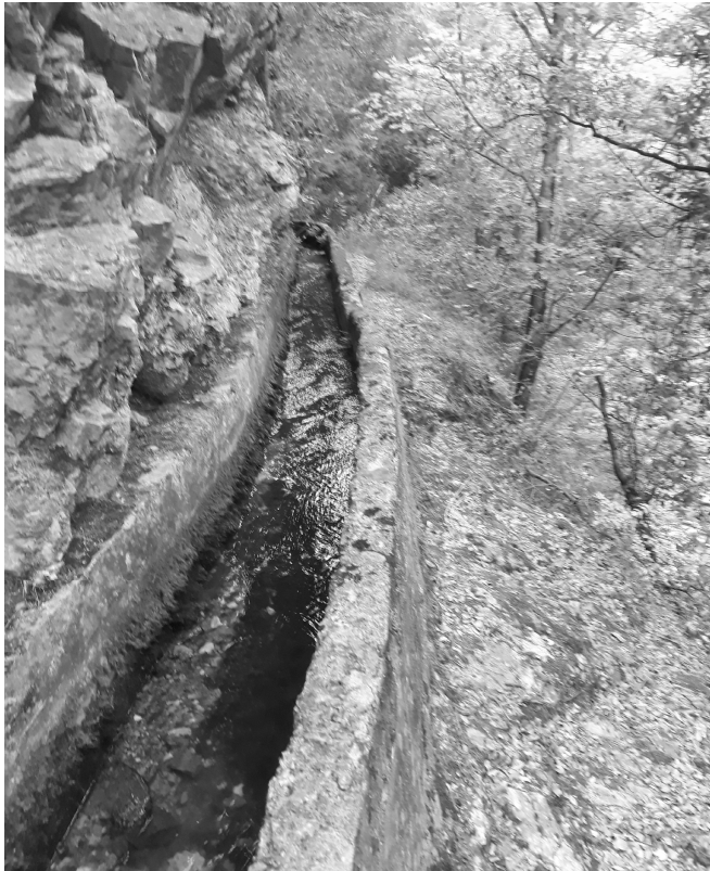
ΠΕΡΙΟΔΟΣ Δ΄ ΤΕΥΧΟΣ 74 ο ΙΟΥΛΙΟΣ 2021