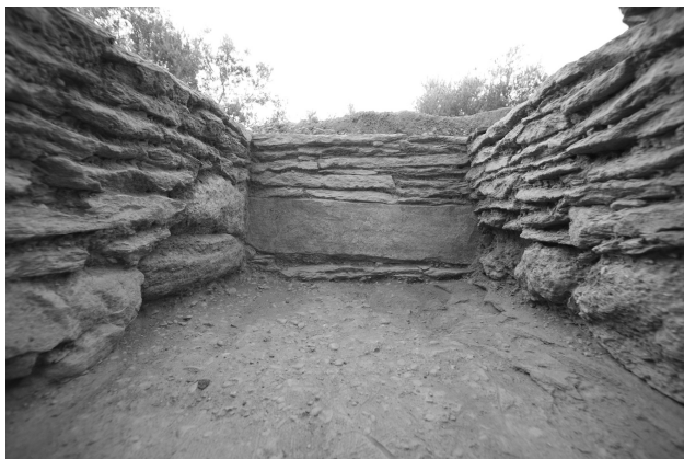
Εικ 3. Τάφος χτισμένος με σχιστολιθικές πλάκες