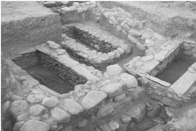
Εικ. 2. Τάφοι στο Βόρειο Νεκροταφείο