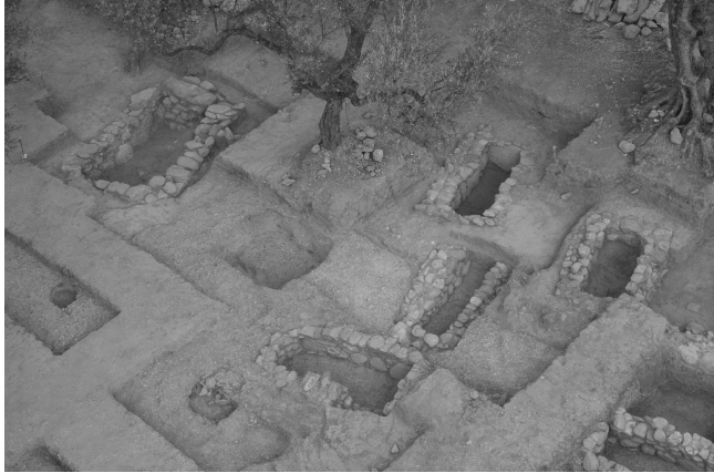
Εικ. 1. Το Βόρειο Νεκροταφείο