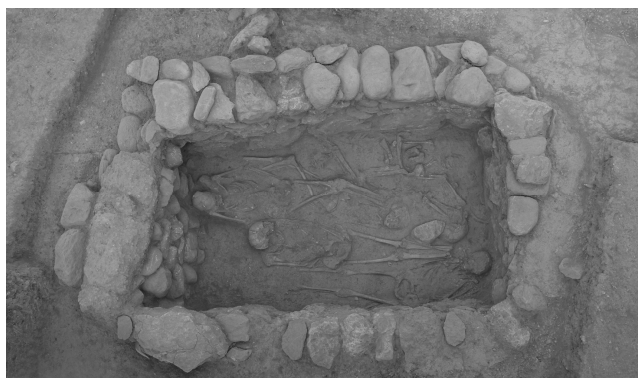
Εικ. 5. Ο μεγάλος τάφος