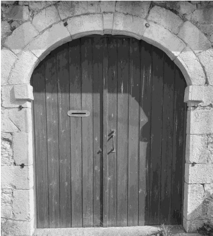
ΠΕΡΙΟΔΟΣ Δ' ΤΕΥΧΟΣ 75 ο ΔΕΚΕΜΒΡΙΟΣ 2021