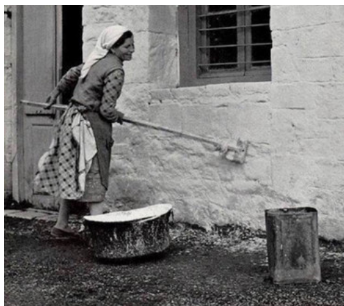
Εικ. 1 Άσπρισμα τοίχου με «μπαντανόβουρτσα» και λευκό υδρόχρωμα, δηλαδή «σβησμένο» ασβέστη σε πολτό, αραιωμένο σε χαρανί 2 με νερό

Ο ασβέστης, βέβαια, χρησιμοποιούνταν, όπως και σήμερα, πρωτίστως στην οικοδομική για τα χτισίματα των τοίχων με πέτρες, πλίθ(ρ)ες, τούβλα και τσιμεντόλιθους, για τα επιχρίσματα (σοφατίσματα) των χτισμένων επιφανειών, αλλά και για τα βαψίματα του περιγύρου, των προσόψεων και των δωματίων των σπιτιών με τα λεγόμενα «υδροχρώματα».