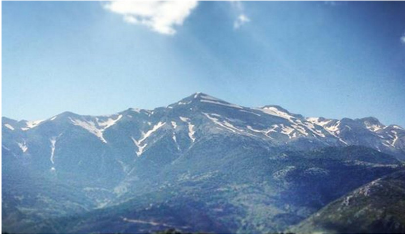
Η ανατολική πλευρά του Ταϋγέτου

Τα μικρά φράγματα κατασκευάζονται in situ , με βράχους και πέτρες (ξερολιθιά), αλλά και μικρότερα λιθάρια που βρίσκονται εκεί (σε πλαίσια από συρματοπλεγμα), χωρίς να απαιτούνται μεταφορές υλικών. Το ύψος τους από την κοίτη τους δεν είναι απαραίτητο να υπερβαίνει τα λίγα μέτρα, ανάλογα με τη θέση τους. Μόνωση από κλαδιά και φερτή λάσπη από την ροή νερού (ή και «κατεβασιές») βοηθούν να γεμίσουν τα υπερκείμενα πλατώματα της κοίτης δημιουργώντας μικρές λίμνες. Αυτές δεν θα συντηρήσουν για πολύ το νερό τους – ελπίζουμε μερικές εβδομάδες ή λίγους μήνες– όμως θα δώσουν χρόνο στους υπόγειους ταμιευτήρες να γεμίσουν. Εξάλλου θα προσφέρουν νερό και στην παρακείμενη βλάστηση και τα γύρω ζώα, όσο χρόνο συντηρηθούν, αλλά και ένα ευχάριστο περιβάλλον στους επισκέπτες.