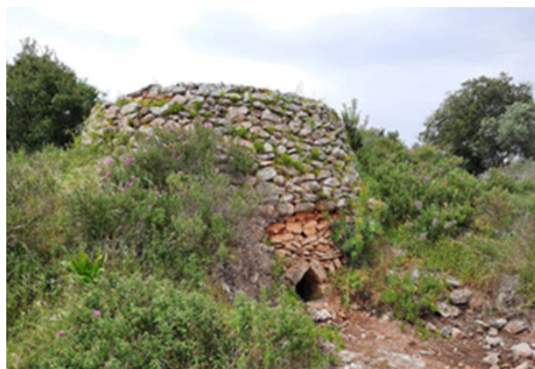
Εικ. 2 Υπαίθριο παραδοσιακό ασβεστοκάμινο

υπολείμματα της καύσιμης ύλης και της πέτρας και τον συσκέυαζαν σε λινάτσες 1 , που συνήθως χωρούσαν ένα καντάρι, δηλαδή 44 οκάδες ασβέστη.