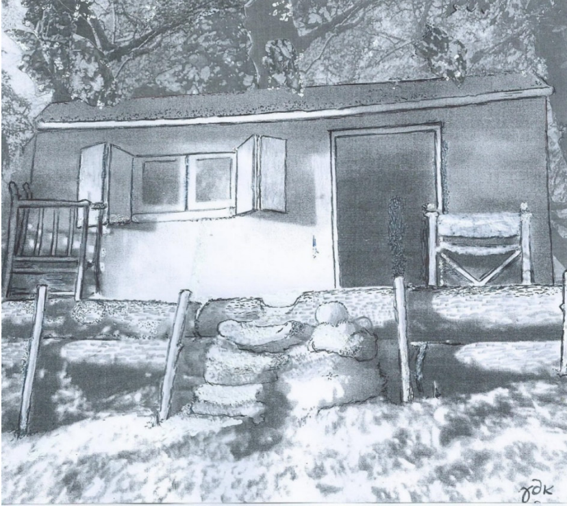
Εύλινη καλύβα της εποχής στον Ταΰγετο

Οι κάτοικοι των γύρω χωριών μας, ιδίως των Γοράνων και της Κουμουστάς, τους έκαναν συχνά παρέα (με προφυλάξεις) και τους «φίλευαν», κυρίως φρούτα. Ήταν πολλές οι φιλίες που αναπτύχθηκαν. Γνωστότερη η φιλία των Γορανιτών με τον από χρόνια ασθενή από τα χωριά της Σπάρτης, που οι ντόπιοι συνήθως τον έλεγαν «παθή» (που έπαθε την φθίση). Μάλιστα αυτός θεραπεύτηκε, έκανε οικογένεια και παιδιά, πολλοί μάλιστα τον θυμούνται να εργάζεται στη Σπάρτη ως υπάλληλος υφασματοπωλείου. Είναι χαρακτηριστικός ο τρόπος που ο γιατρός Μενέλαος Ξανθάκος, από την Πολοβίτσα, του ανήγγειλε χαρούμενος την γιατρεία του. Του έσπασε το θερμόμετρο.