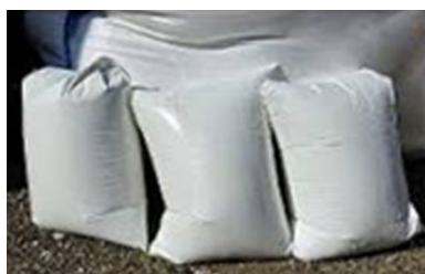
Εικ. 3 «Ασβηστος» ασβέστης σε σκόνη χύμα (αριστερά) και «σβησμένος» ασβέστης σε πολτό, συσκευασμένος σε νάιλον τσουβάλια (δεξιά)