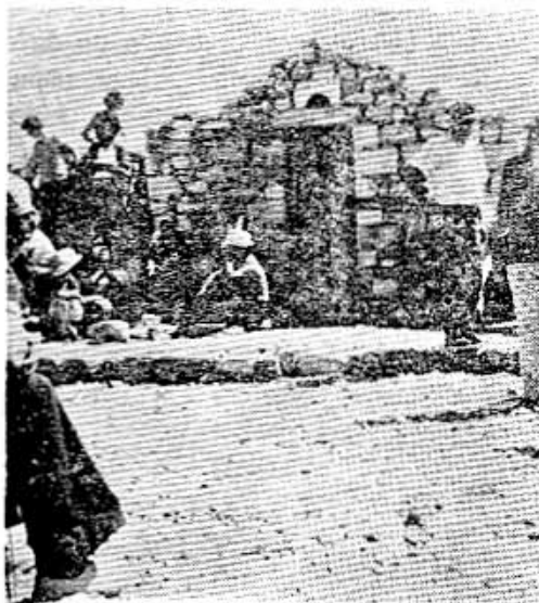
Τό εκκλησάκι τ' Αι—Λιός

Ταυγέτου, που σχηματίζει τό φόντο του Σπαρτιάτικου κάμπου κατά την δύση, αρχίζει νά ξετυλίγεται σέ όλο της σχεδόν τό μάκρος μπρός στά μάτια του ταξιδιώτη, όταν, έρχόμενος από την Τρίπολι, την άγναντέψη από τ' αντικρυνά ύψώματα του Βρουλιά και τά Βουνά της Σελλασίας. Όσο προχωρούμε, τόσο και τό γιγάντιο Βουνό, μέσ' από την