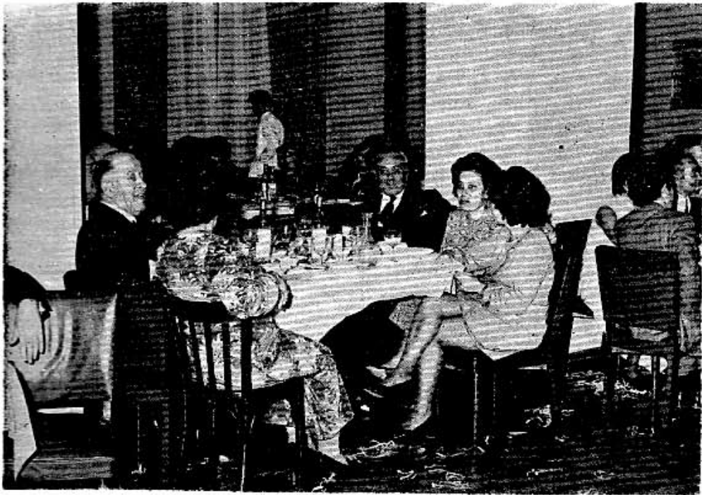
Ἀπὸ τὸ χορὸ τοῦ Σ. Α. Σ. Φ. στὴν Ἀθήνα.

ΜΠΟΡΟΥΜΕ ἄφοβα πιά νά ποῦμε, πὼς ὁ ἐτήσιος χορὸς τοῦ ΣΑΣΦ στὴν Ἀθήνα καθιερώθηκε καὶ ἐπιβλήθηκε σάν μία μεγάλη ἐκδήλωση τοῦ εἴδουςτου.