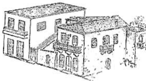
Δυό σπίτια, δυό έποχές — τά Σταθαίικα στο Σηροκάμπι.

Οι κατοικίες των πατέρων μας, έρειπωμένες