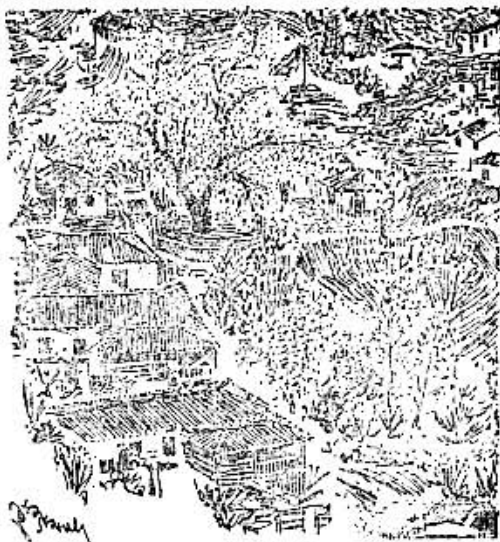
Ἀνοιξιάτικη ἀποψη τῆς Κομμουστᾶς, μὲ τὴν βρύση καὶ τὰ σπίτια τῆς Κάτω Χώρας.

Ὅπως τὰ βλέπουμε στὰ πιὸ παλιὰ, ὄρεινὰ χωριά μας, τὰ σπίτια τῆς πρώτης «γενεᾶς»