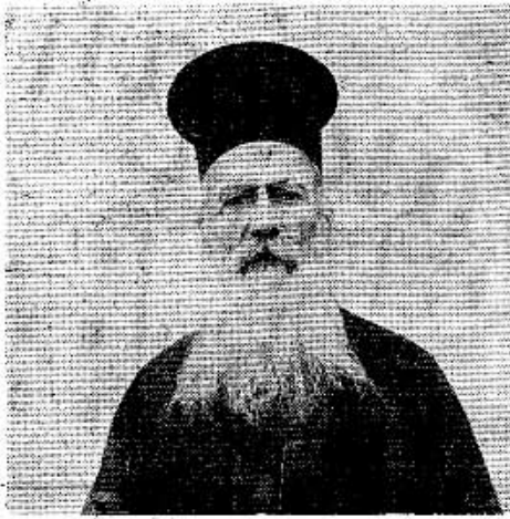
Ο ΓΥΡΟΣ ΤΩΝ ΩΡΩΝ